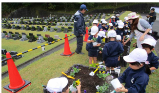
引率の先生も、大忙し

お盆・お彼岸の両期間中、社会福祉活動の一環として、笑顔で社会参加できる場・たくさんの方々の笑顔が集まる相互交流の場」となるように、障がいのある方々が各種クッキーや小物雑貨等、施設で作ったものを自ら販売いたしました。