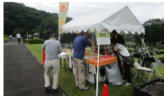
テントを張り、販売しました