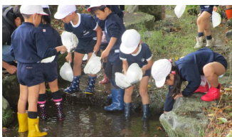
昆虫は、見つかったかな?