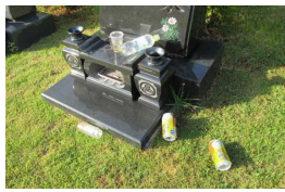
お供物の散らかし