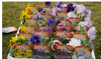
この一年草を植えました(約130鉢)