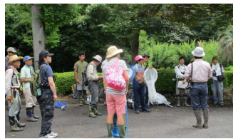
調査前のご挨拶です