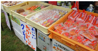
大好評でした、みかんパンです 当日終了時には、完売しました

六月、市内自然観察会のサークルによる、トンボの生息調査・観察会の催しが行われました。幼稚園のお子さんから、お年寄りまで約30名の方が参加され、予定時間を大幅に過ぎるなど大盛況のうちに終了しました。