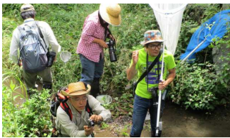
水の中も、なんのその!!