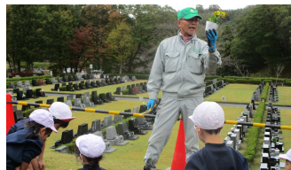
植え方の説明中。わかるかな??