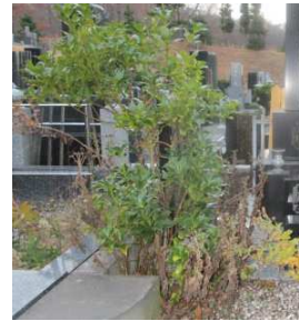
隣接墓地へのはみ出し