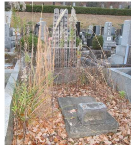
未建墓石内の雑草

土屋霊園では、墓石内の植栽管理については、ご使用者様ご自身で行っていただいております。皆様が気持ちよく墓参できるようにご理解とご協力をお願いいたします。