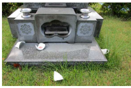
カラスによる陶器の破損

お墓詣りの折にお供えしたお供物(飲食物)は、できるだけお持ち帰りいただきたくお願いいたします。カラスや野生動物が墓所内を荒らす原因となります。また、同時に墓石に備えてあります陶器・ガラス容器等を破損することがあり、墓参された方がけがをする危険性もあります。ご協力のほど、お願いいたします。