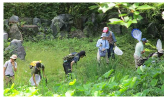
みなさん、真剣です