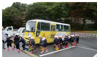
さ～、これから植え込みだー

十一月、平塚市内幼稚園児による一年草の植え込みを霊園指導員のもと行いました。五つの花壇に植え、従事者もお手伝いさせていただきました。植え込み終了後、園内せらぎにて、昆虫の観察・木の実の採取を行い、無事終了いたしました。